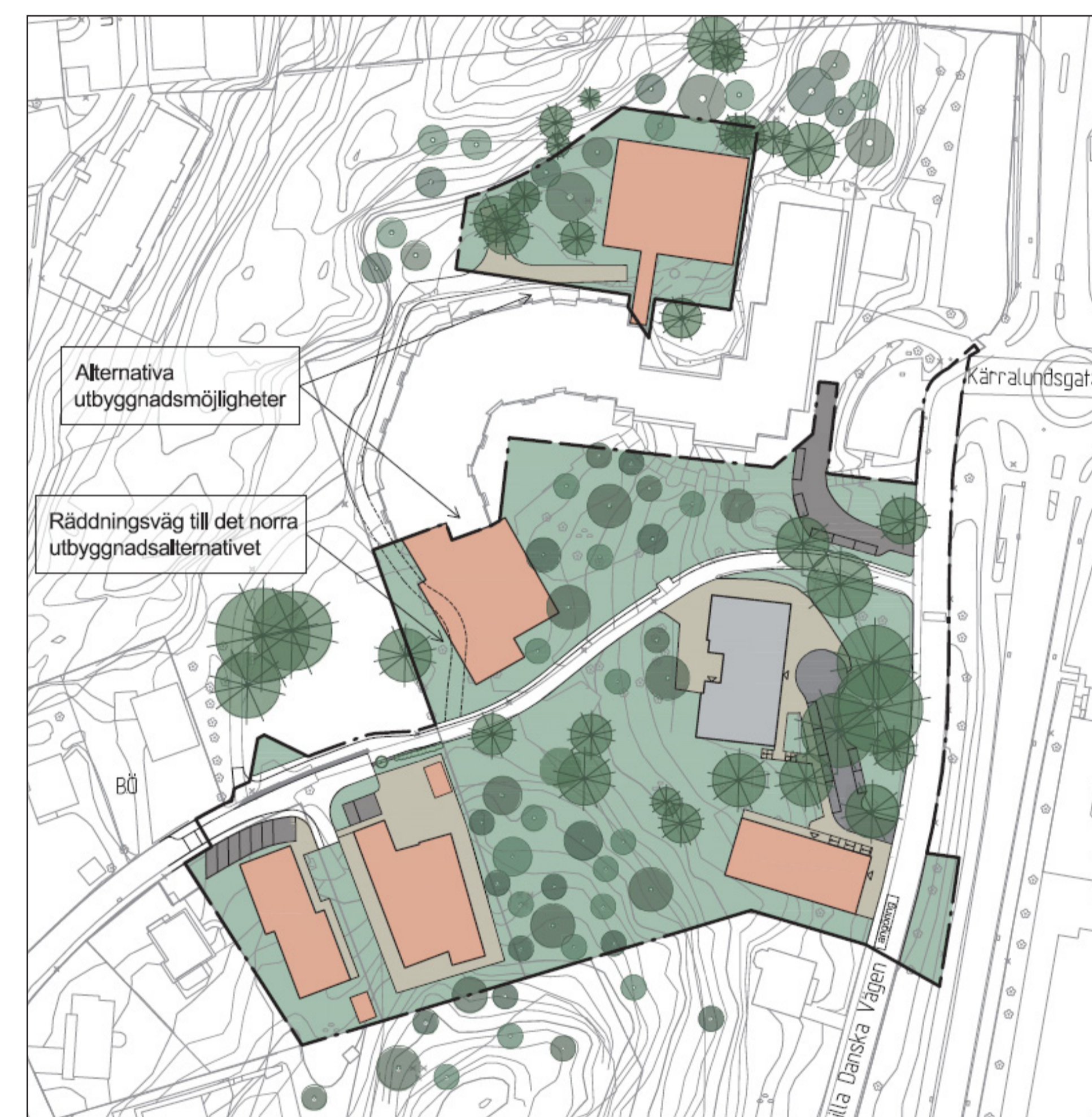
Illustrationsritning med föreslagna byggnader i orange och den befintliga Skogshyddan i grått. Endast en av den två alternativa utbyggnadsmöjligheterna till skolan får uppföras.